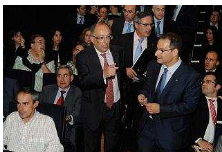
El presidente de Puertos del Estado, González Laxe, de pie a la izquierda, ayer, en la clausura del curso de la Escuela de Finanzas.

Supera casi en un 50% a la siguiente y es 13 veces mayor que la más saneada. La entidad portuaria coruñesa es la más endeudada de España si se tienen en cuenta sus ingresos, según aseguró ayer el presidente de Puertos del Estado, Fernando González Laxe. La deuda a largo plazo es tal que supone un obstáculo para que la financiación europea se encargue de sanear el sobrecoste de 100 millones de euros de la obra del puerto exterior. "No puede ser que hagamos algo que después no podamos pagar", apostilló Laxe, como un consejo de padre para que las cuentas de la Autoridad Portuaria no destaquen por sus puntos negativos. Asegura que Langosteira es un "problema de la ciudad y de Galicia", aunque se ofrece a trabajar para su desarrollo